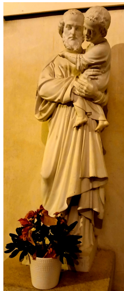
Statue Saint Joseph dans l'église de l'Immaculée