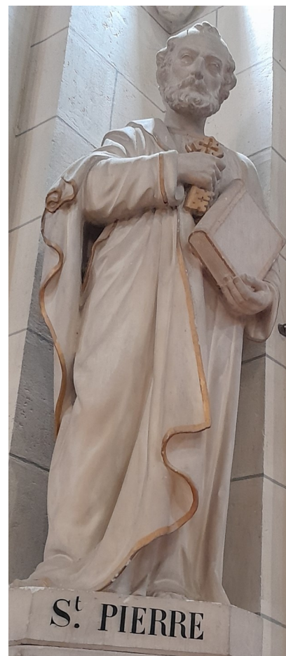
Statue St Pierre dans l'église de Saint-André des Eaux