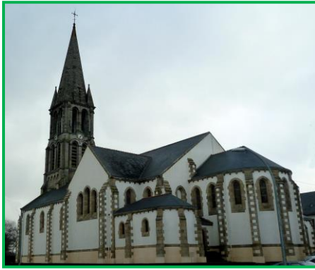
Immaculée Saint-Nazaire 14 rue Jules Simon Tél. : 02 40 01 86 99